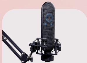
DL55 Condenser microphone