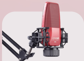
KD96 Condenser microphone