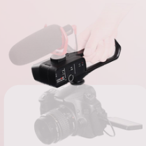
D1L Audio adapter