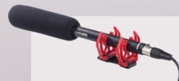
DM2000 broadcast microphone