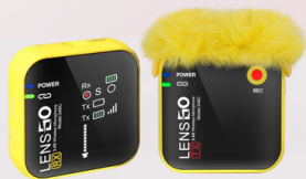
348C wireless microphone