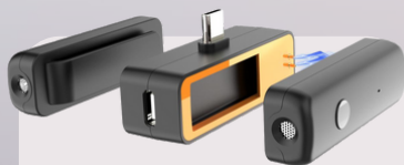
518C II wireless microphone