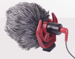
DMM1 broadcast microphone