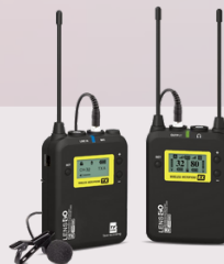
328C wireless microphone