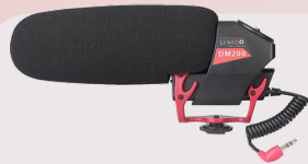
DM200 broadcast microphone