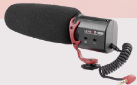
DM30 broadcast microphone