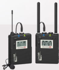
338C wireless microphone