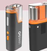
15D MINI / PRO Smoke generator