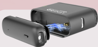
318C III wireless microphone