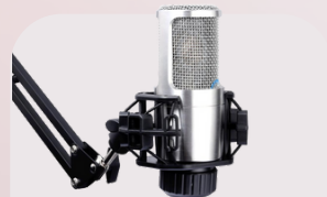
DL77 Condenser microphone