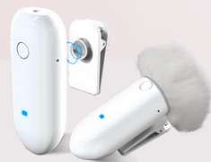
318C wireless microphone