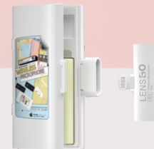
518C wireless microphone