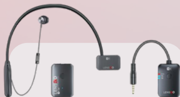
318D wireless microphone