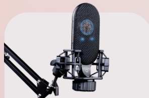
DL66 Condenser microphone