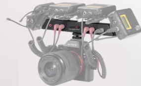
D2L Audio adapter