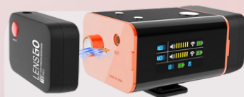
348C II wireless microphone