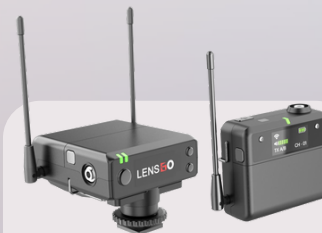
328C II wireless microphone