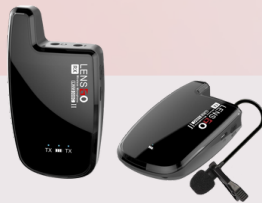
308C II wireless microphone