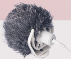
DMM1W broadcast microphone