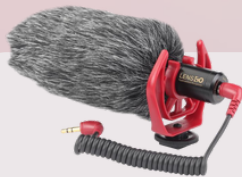
DMM2 broadcast microphone