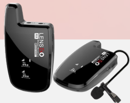
308C wireless microphone