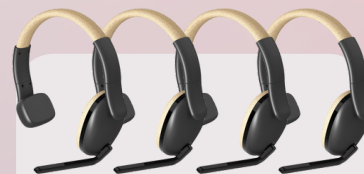
W22 Communication system