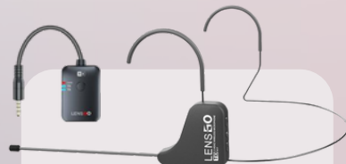
K17 wireless microphone