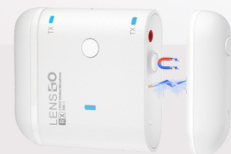
318C II wireless microphone