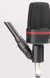
KD95 Condenser microphone