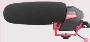
DM300 broadcast microphone